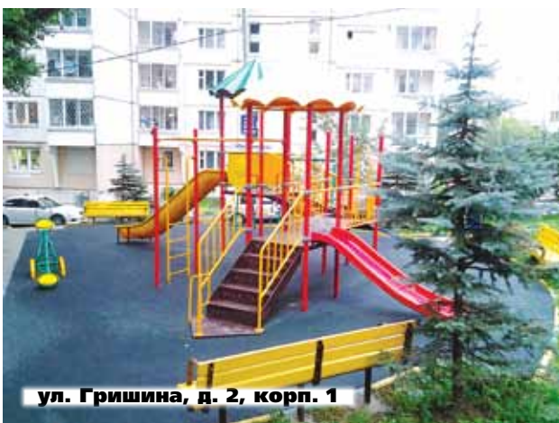
ул. Гришина, д. 2, корп. 1

Их них 13 строений ожидает ремонт кровель (ул. Говорова, д. 10, корп. 2; ул. Горбунова, д. 9, корп. 1; ул. Гродненская, д. 9; ул. Вяземская, д. 1, корп. 2; ул. Кубинка, д. 10; Можайское шоссе, д. 9 и 10; Сколковское шоссе, д. 22, корп. 1 и 2, д. 26, корп. 1 и 2, д. 36; ул. Толбухина, д. 5, стр. 3. Ремонт балконов будет проведен в доме 9, корп. 2 по ул. Толбухина (это бывший дом ОАО «ВИЛС»), а еще в 5 строениях (также бывших домов ОАО «ВИЛС») — ремонт отмосток (ул. Багрицкого, д. 24, корп. 1, 2; Сколковское шоссе, д. 2, 4, 11). Устройство системы ГВС планируется в доме 33а по ул. Красных Зорь. Еще в шести домах должна быть проведена замена транзитного трубопровода центрального отопления (ул. Вяземская, д. 1, корп. 1, 3; д. 3, корп. 1, 2, 3;