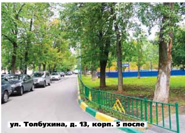
ул. Толбухина, д. 13, корп. 5 после