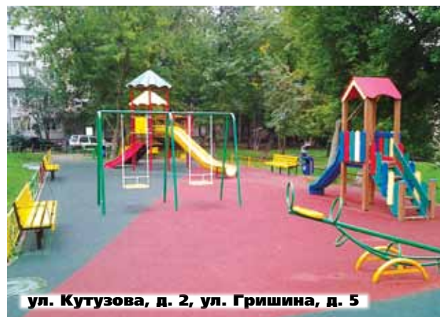
ул. Кутузова, д. 2, ул. Гришина, д. 5

Сколковское шоссе, д. 20). Замена внутридомового газопровода и вынос газопровода из подъезда планируется в доме д. 18 по ул. Барвихинская.