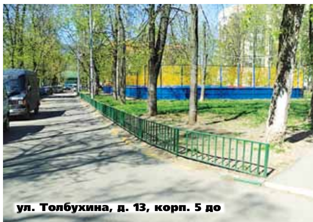
ул. Толбухина, д. 13, корп. 5 до

В 2013 году будут отремонтированы места общего пользования в 484-х подъездах. Уже оформляются акты открытия и приступают к работам. С адресным перечнем