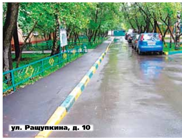
ул. Ращупкина, д. 10